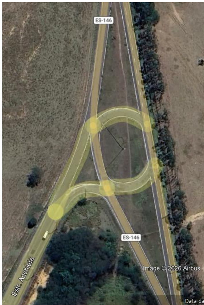
Trevo de acesso a Anchieta. Passa na ida e na volta